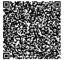
Imagen Accesorios opcionales