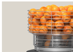
Cesta en dos tamaños

La máquina incluye de serie una cesta de 9 kg de capacidad con tapa que impide el acceso a las naranjas. En los casos en los que se necesite una autonomía mayor, existe una cesta opcional que tiene una capacidad de carga de 16 kg de fruta.