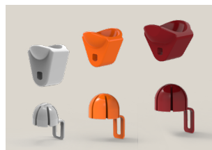
Kits de exprimido

Un sistema desarrollado por Zummo para montar y desmontar las bolas del kit en un solo movimiento.